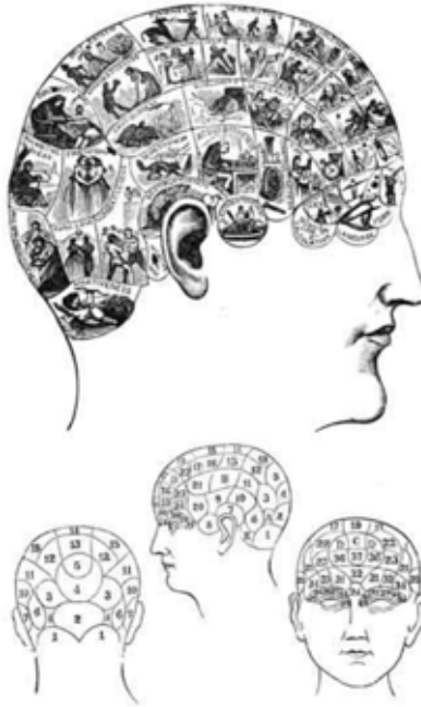
The People's Cyclopaedia of Universal Knowledge: (1883) W. H. De Puy

humanos en búsqueda de similitudes y parecidos con los semblantes animales, asociación que conllevaba la proyección de las supuestas características animales al hombre cuyo rostro guardaba alguna semejanza zoológica (Mariaca, 2010).