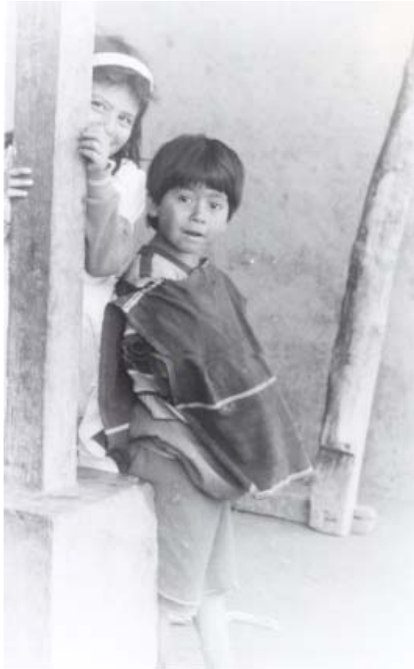
RESGUARDO DE GUAMBIA, 1991

Hábitat transitorio y vivienda para emergencias