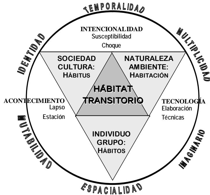
Gráfico 01. Interpretación del Hábitat Transitorio

De acuerdo con Rubén Pesci «el ambiente no es; se hace» suponiendo cambios y desafíos, movimientos e interpretaciones vitales, para todas las especies (2000: 125). Si examinamos la relación hábitat-transitoriedad, podemos anticipar esta modificación de los comportamientos en los habitantes de un ambiente –léase hábitat- según el medio físico transitorio en el que suceden y sobre el cual, Amos Rapoport ya había sentenciado: